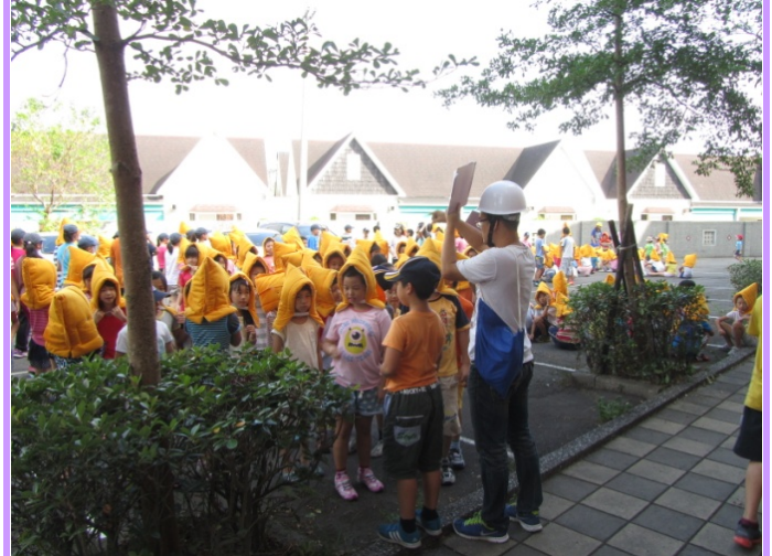
避難點老師集合與點名