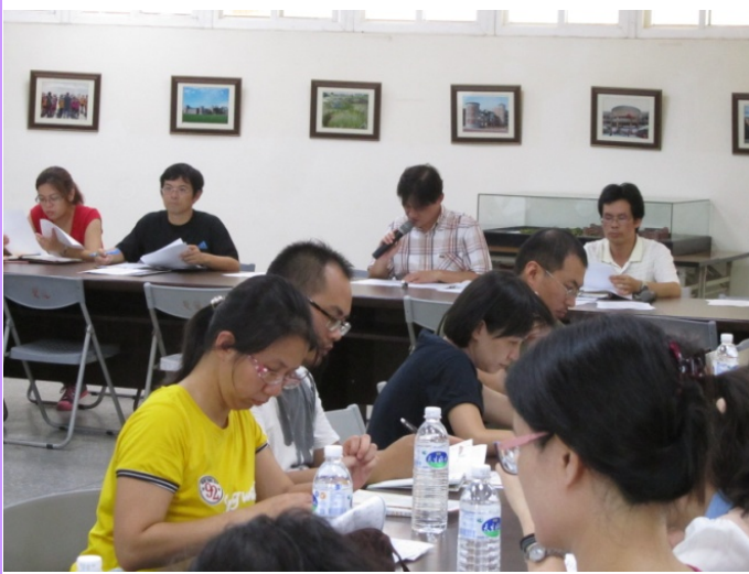
防災小組結論於教師會議轉達