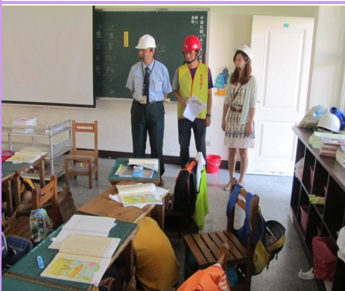
教育局長視導學生就地避難