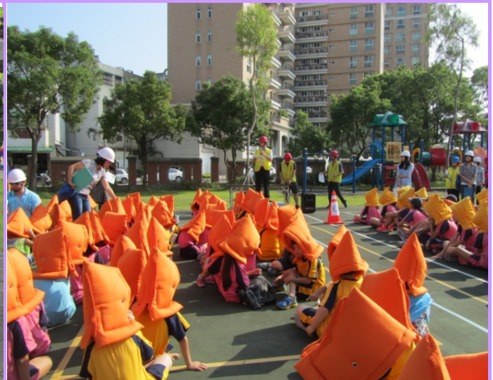
至避難點後校長進行防災教育