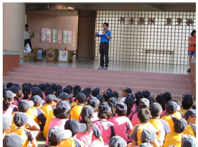
主任於升旗時進行防災教育