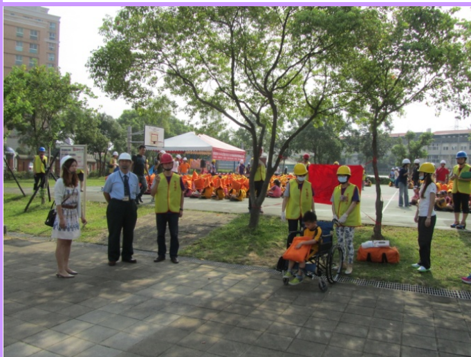
教育局長視導急救站