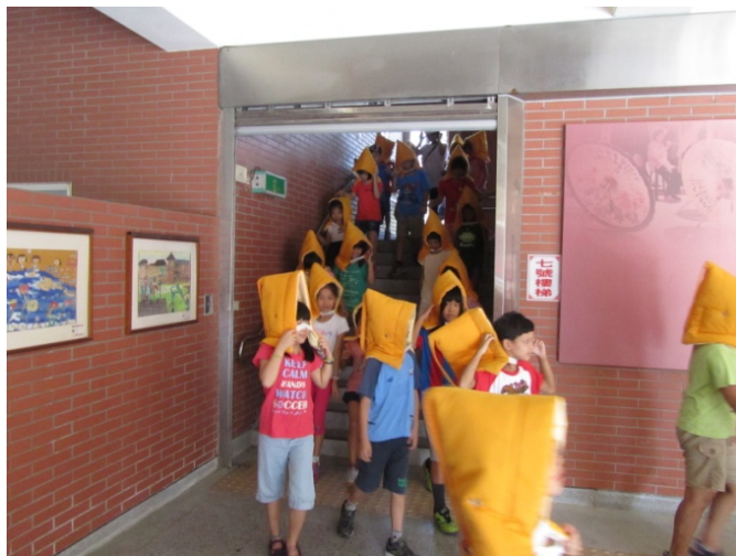
學生進行避難疏散路線