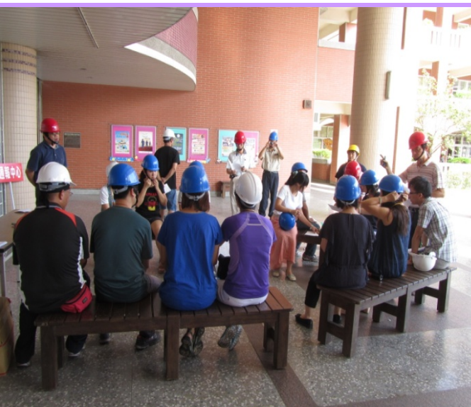
校長主持準備會議