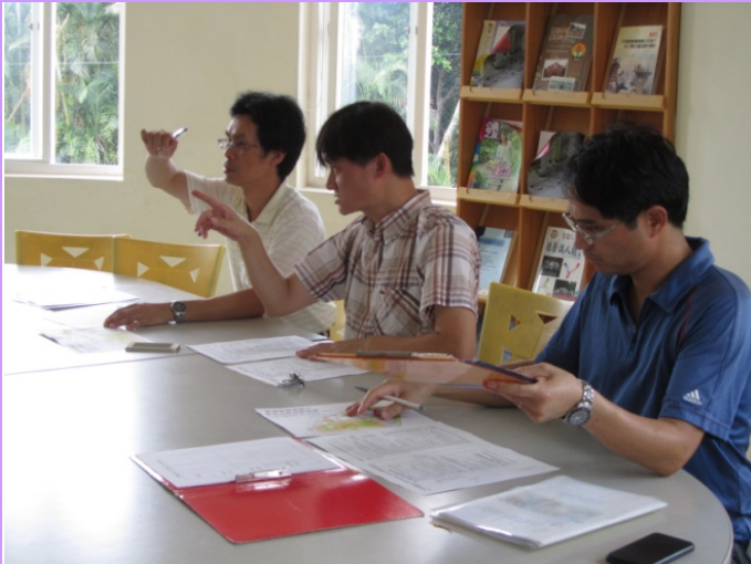
由校長防災小組會議