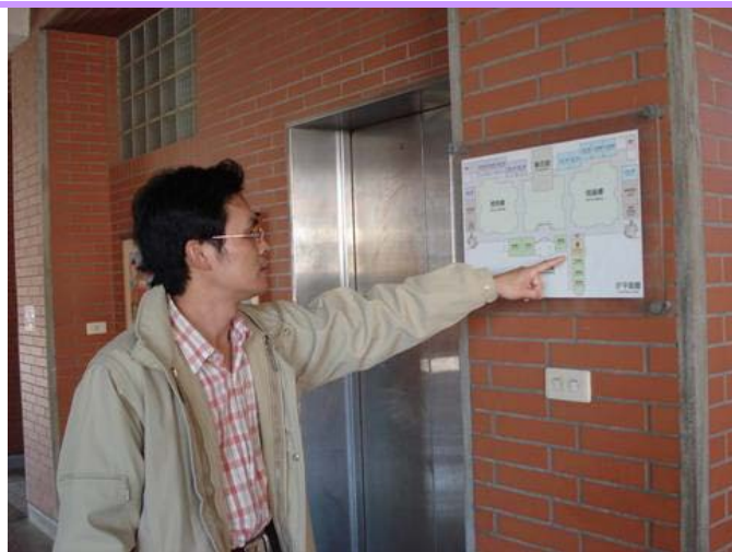
避難路線公告於各樓梯口