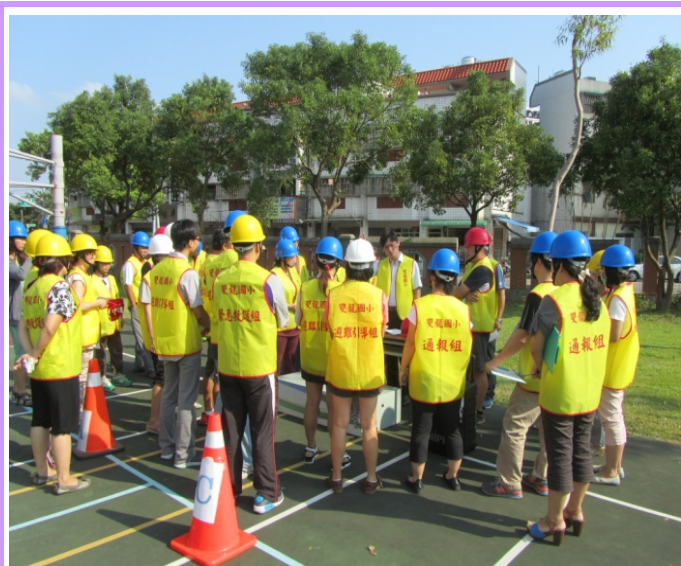
演練後的檢討會議