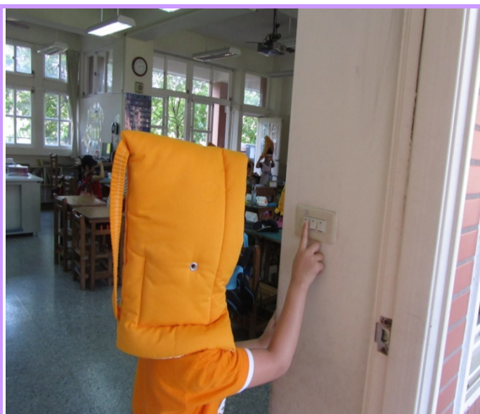
避難時的注意事項-關燈