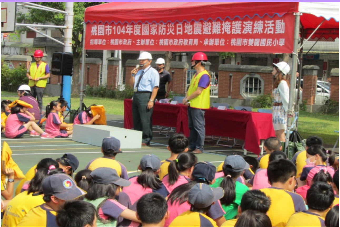
教育局長勉勵全體師生認真演練