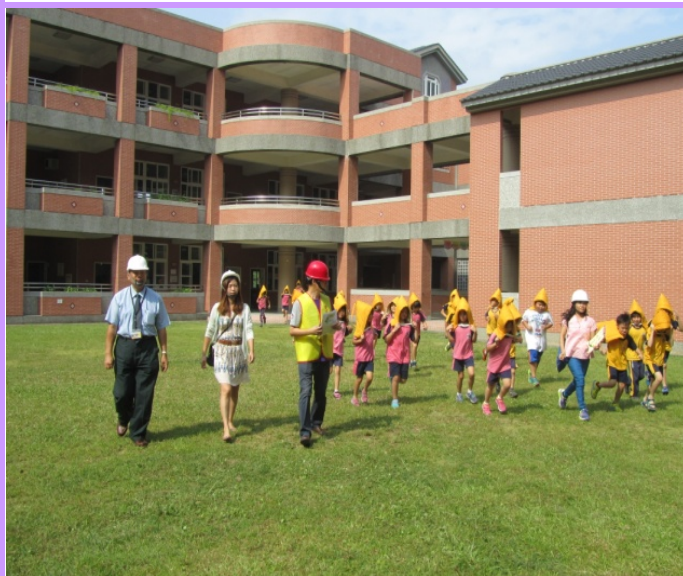
教育局長視導學生疏散過程