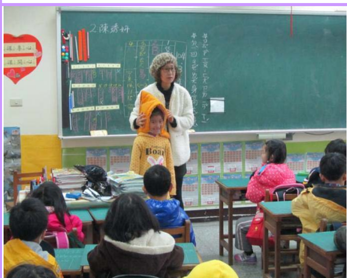
老師解說防震頭套的正確使用